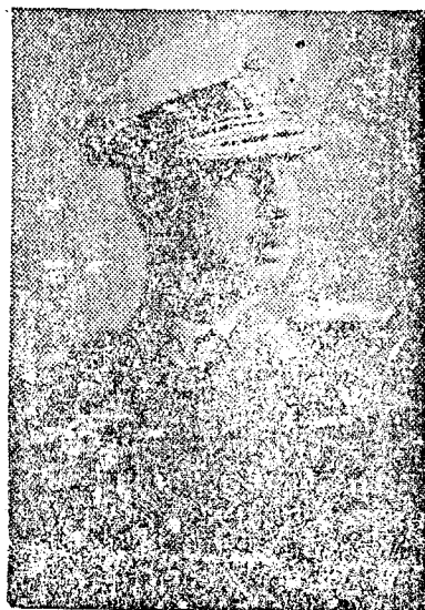
Az Asztra román

II Károly király, mint a Kárpáti Solymok Nagy Tribunja.