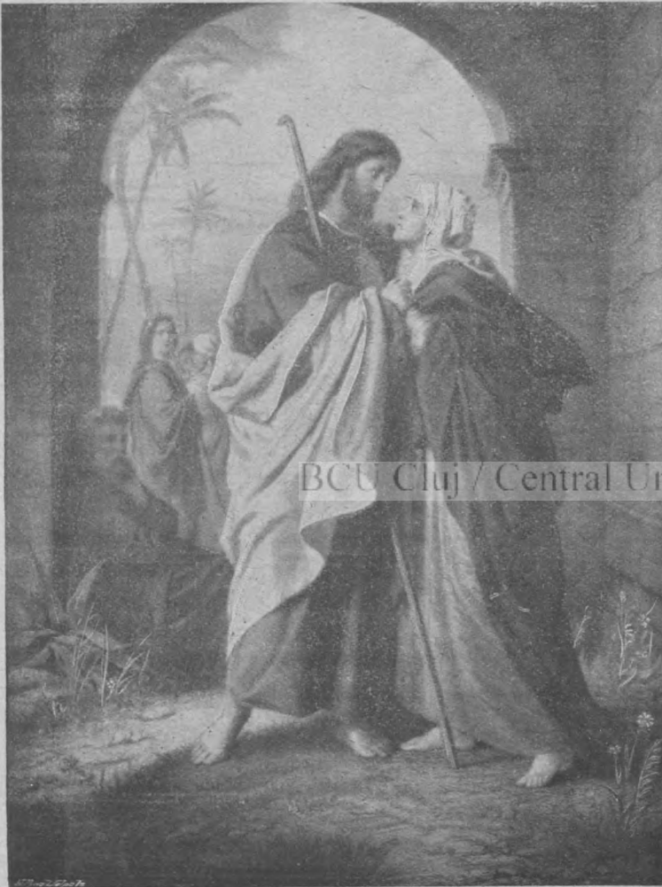
Jézus bucsuzik anyjától. Máté 4, 3.