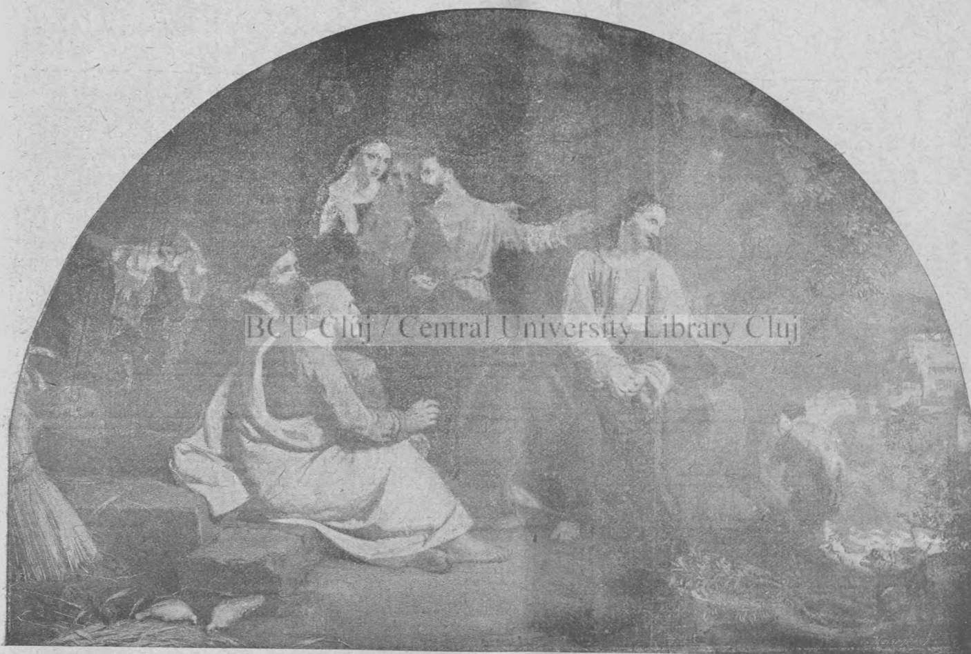
Jézus megjósolja Jeruzsálem pusztulását. (Máté 23.)