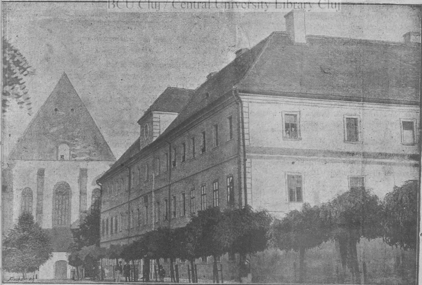
A kolozsvári református kollegium.