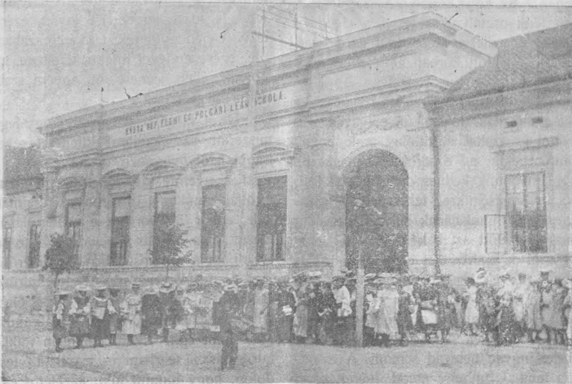
A marosvásárhelyi református polgári leányiskola.

BCU Cluj / Central University Library Cluj