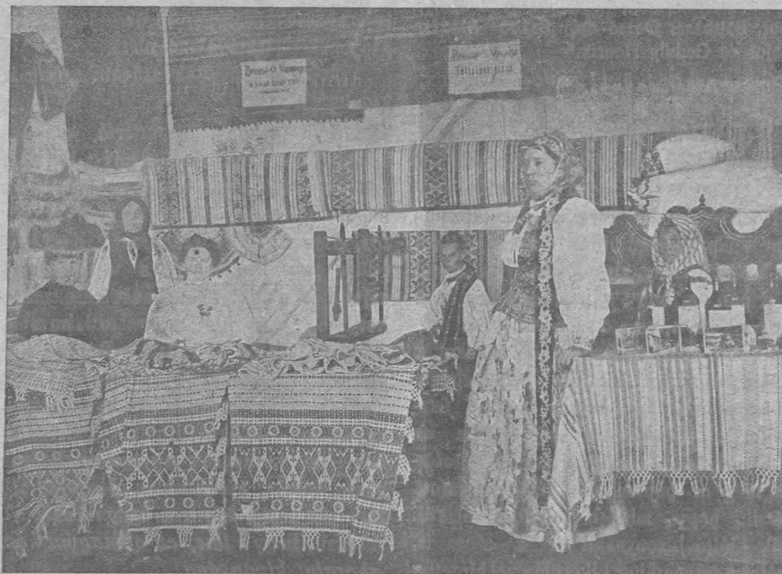
Székely varrottások Sepsiszentgyörgy vidékéről.