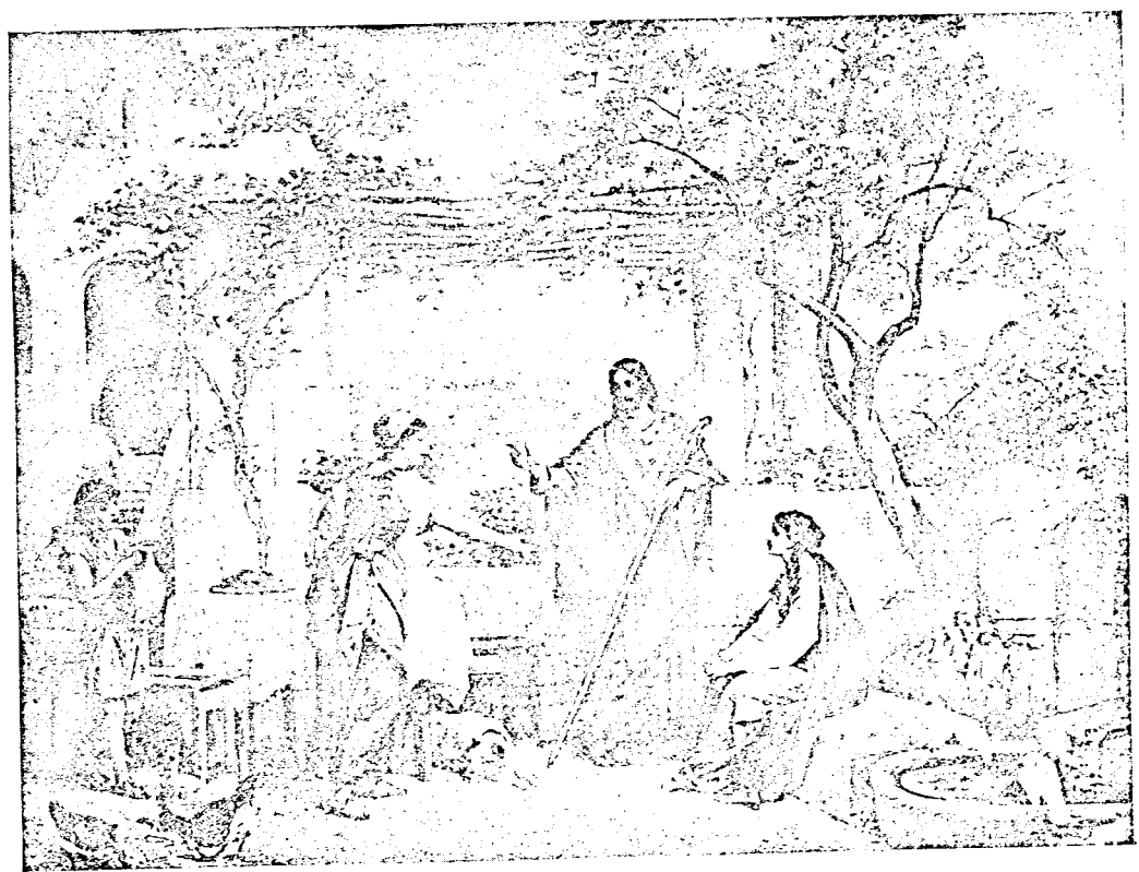
fi bethániai család.