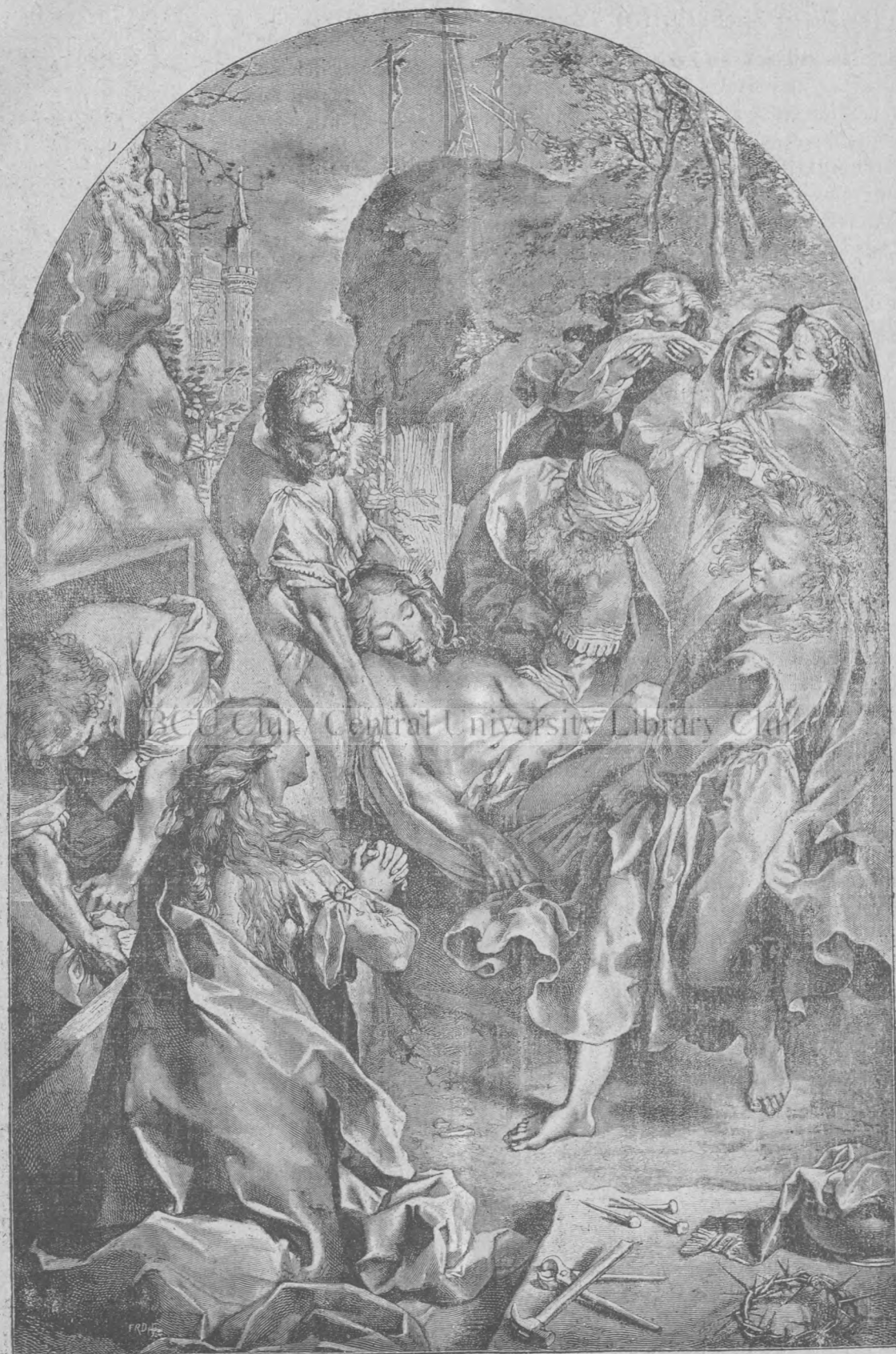
Jézus Krisztus levétele a keresztfáról.