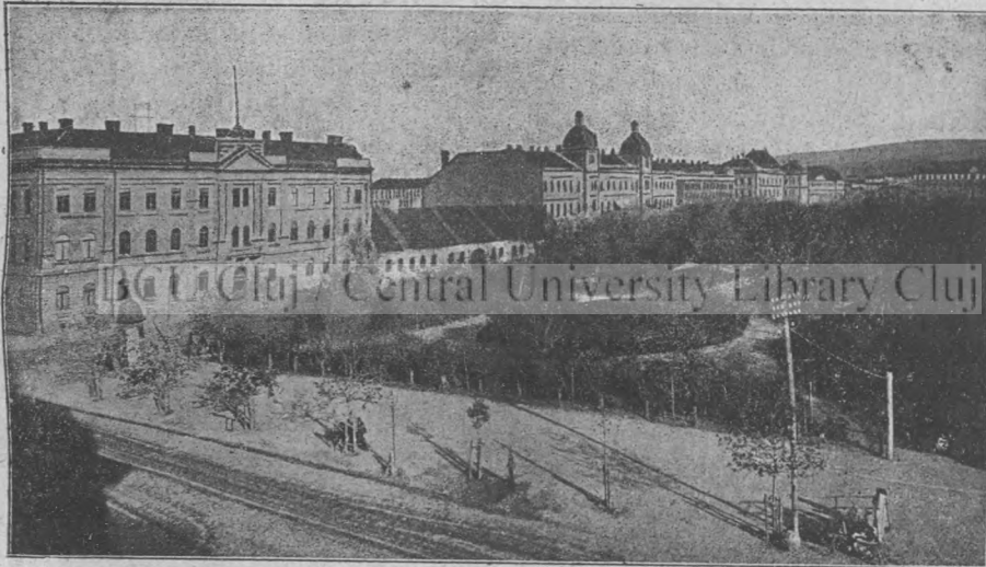
Emke-téri park Kolozsvárt.

28. 29. 30. Meszeltettünk. Fizettünk a kömiveseknek — 282 pénzt.