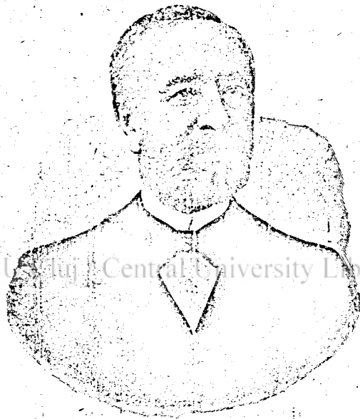
PAP KÁROLY, 1832–1905.

A képviselő választások eredménye, jó részt, már tudva lesz, mire ezek a sorok napvilágot látnak. A pártok már hajlíthatatlanok, kapacitáltni nehezen lehet az embereket. Azonban az utolsó pillanatok sok meglepetést fognak eredményezni. Elbuknak azok, kiknek megválasztását bizonyosra vették és meglesznek azok, kiknek kevés reményük volt a győzelemhez. Így szokot történni minden választás. A politikai jósok azt mondják, hogy a kormánynak, ha lesz is többsége: nagyon kevés lesz. Az ellenzék arra számít, hogy legalábbis 200 kerülete lesz. Ez esetben a kormány többsége 13 lenne. Szerencsétlen szám. Ám ez, mint mondók, mind csupa számítás. Jan. 26-ika, s a rá következő két-három nap mondja meg az eredményt. Akár melyik párt legyen a győztes: legyen a magyar nép között egyetértés és békesség.