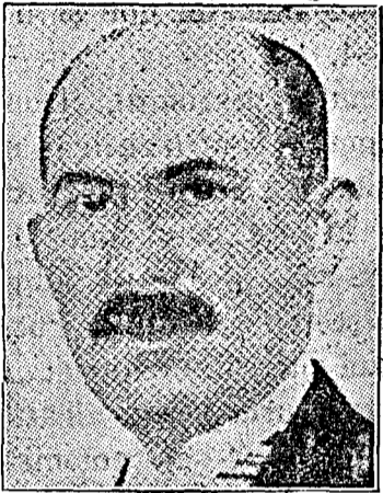
D. Gh. Ionescu-Sisești Ministrul Agriculturii și Domeniilor.

Domnule Președinte, Domnilor Deputați, la art. 6 din proiect se prevede, pentru românii veniți de peste hotare, excepțiunea de a fi admiși provizoriu la colonizare, înainte de a fi obținut cetățenia română și de a fi să-ți făcut legea recrutării.