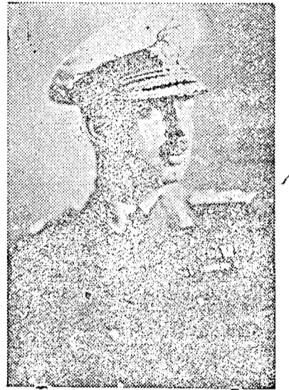
M. S. Regele CAROL II

„În timpurile grele ale trecutului, Poporul Nostru a arătat atât de luminos înaltul său simț patriotic, a arătat că oricari ar fi urgiile vremurilor, România a pro-