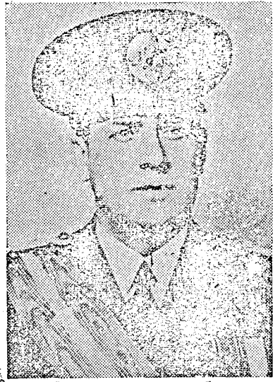
D-I PETRE ANOREI Ministru Educației Naționale

La această măsură, au protestat părinții elevelor, au făcut memorii administrația județului