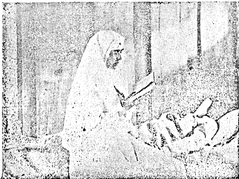
M. S. Regina Maria, la căpătăul ostașilor răniți

Acum când se împlinește anul de când Regina Maria a trecut pe celalt țărm, românii recunoscători în genunchiază la mormântul dela Argeș, sărutând lespedea rece și rugând pe Dumnezeu s'o odihnească în raiul celor drepi și buni.