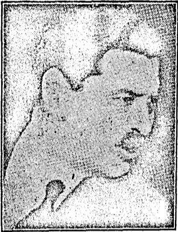
M. S. Regele Carol II

„Un prinț născut pe pământul României, crescut în mijlocul Națiunii, peste care într'o zi va fi chemat să