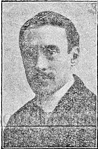
† I. G. DUCA

fecți de carieră, și guverne din sânul parlamentului.