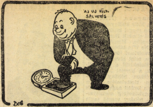
Szigorú önkárékoskodás eredményeként, a költségvetés csak 222 millióval növekedett. (A sajtóból.)