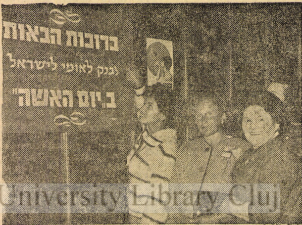
Az asszonytőlensek eljönnek az ország minden részéről

A Bank Leumi a napokban telavivi főirodájában megtartotta az „Asszonynapot”, amelyen az ország minden részéből a bank női klijensei vettek részt. Nagy számban képviselték magukat a fejlesztési területek, a mezőgazdasági pontok és az új ölételepü-