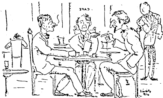
Színepadi szerzők a kávéházban