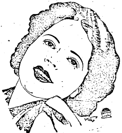
Clara Bow, az amerikai filmjátszás egyik csillaga