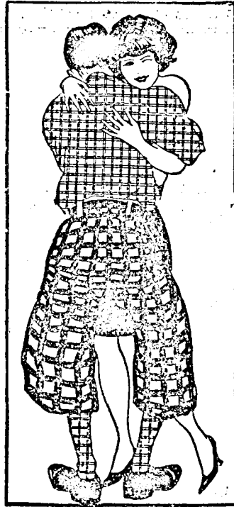
Clara Bow és Eddie Contor táncolnak