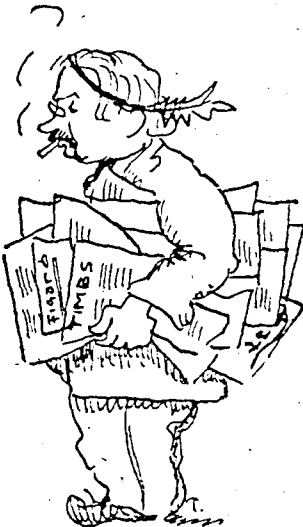
Bucsuzik a színlaposztó

— Azt már nem instálom, — fakadt ki a gyanúsított — az előbb jött ide egy ur és megkért, hogy tegyem ki ezt a könyvet a kirakatba.