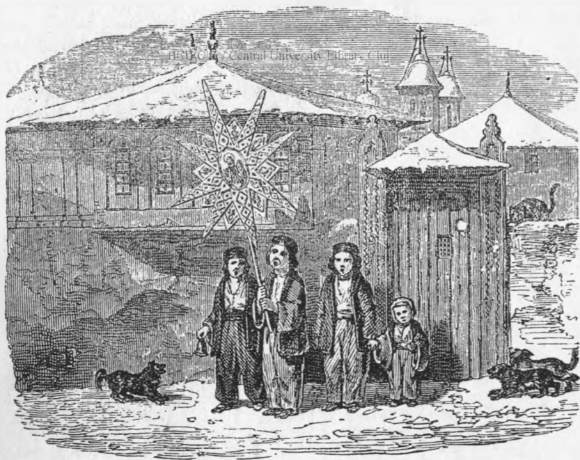
BĂIEȚI CU STEAUA, ÎN BUCUREȘTI (după Doussault).