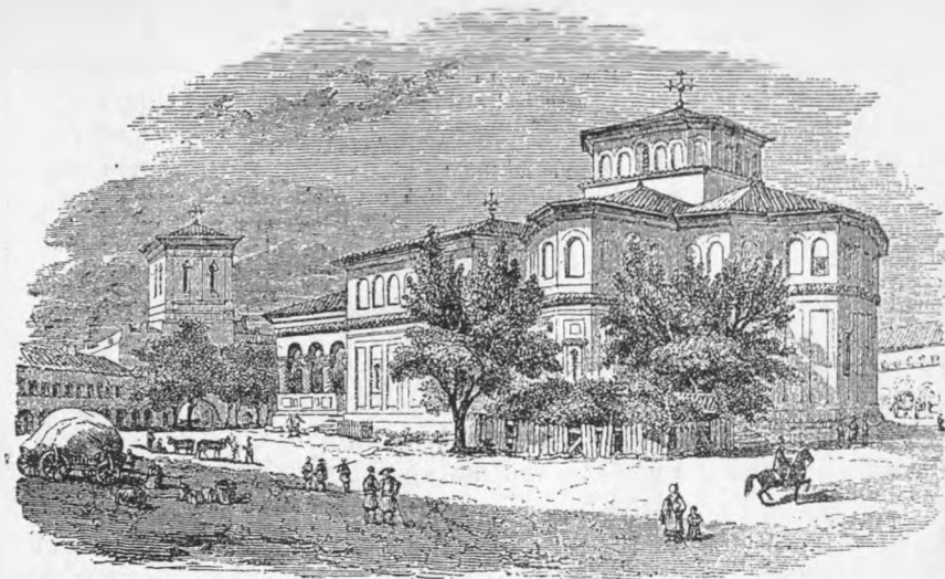
BISERICA SF. GHEORGHE NOŪ DIN BUCUREȘTI (după Bouquet).