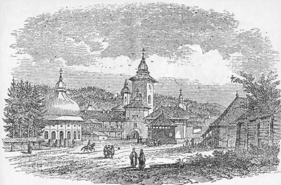
MĂNĂSTIREA NEAMȚULUI (după Bouquet).