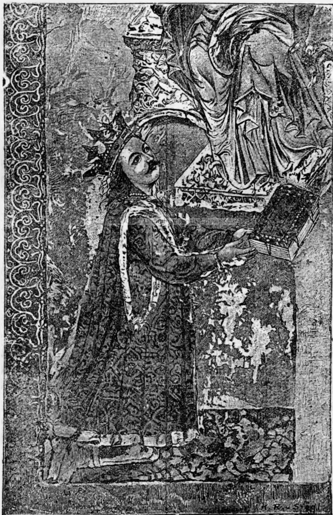
Ștefan-cel-Mare (după Evanghelia de la Voroneț).

Dar ce vom zice pentru a lui dulce milostivire? Ce casă, ce familie în pământul acesta din pricina lui s'a cernit? Plînsul și lacrămile erau pentru vrăj- mașii noștri! Iar noi, ca niște fii în casa părintească,