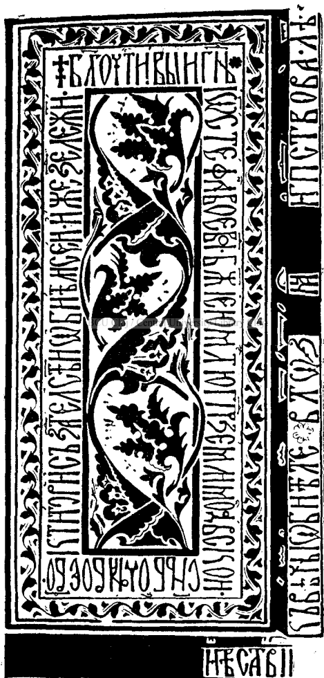
Piatra de pe mormîntul lui Ștefan-cel-Mare.

E mai de crezut însă, fiind vorba de o cuvîntare la «îngropare»,