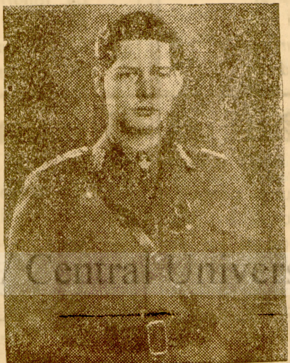
M. SA REGELE MIHAI I

Nu este inimă românească să nu tresalte de bucurie, și să nu-i mulțumească lui Dumnezeu, care, după grele încercări pentru noi, ne-a arătat, iar, că dreptatea neamurilor nu poate pieri, răsplătind neajdeja și suferințele cari ne-au fră-