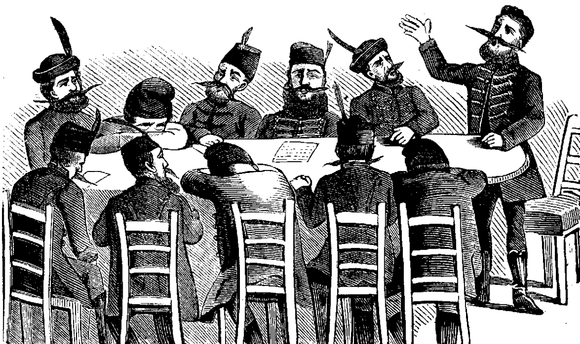
În adunarea comitatensă.

Proprietariu, redactoru respundiatoriu și editoru: Iosifu Vulcanu.