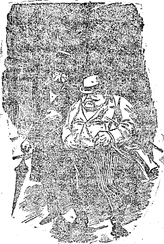
Dela băi, acasă.

— Ai fost să faci o cură de slăbire? — Da, și cu un efect miraculos. — Cu cât ești mai ușor? — Cu două mii de lei.