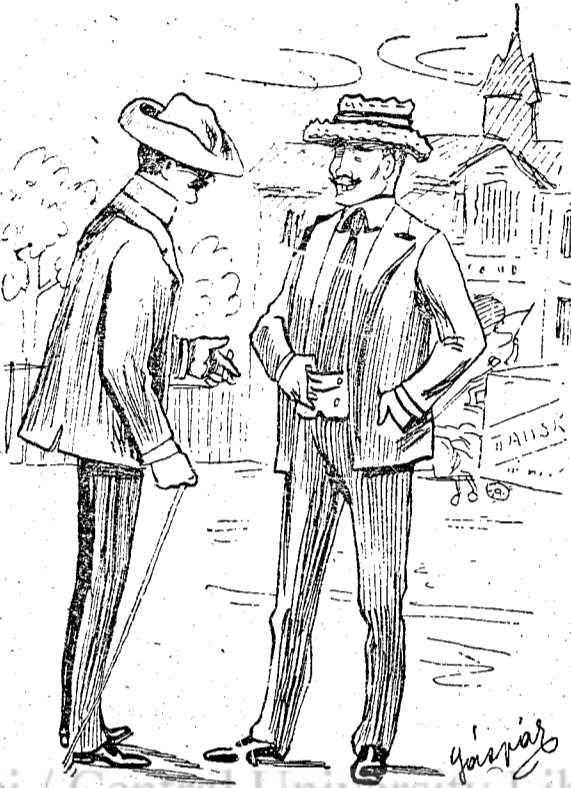
L'a pișcat urît