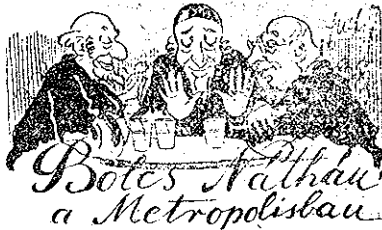
Botes Adhau a Metropolisban

O bokovinai hotáron ész nélkül szolod edj nyul Lenjelországbo. Ezt meglátjo edj lengyel nyul és rákiobál: „Héhé, havá szolodsz odj, te fotóbaland?” Oz első nyul ijedten körülnéz és ódj mandjo: „Szolodok, kamerád, mert odaát nálonk ütik o zsidókat!” O másik nyul csadálkozvo mandjo: „Mi oz, hodj ütik o zsidókat? Mi küze von edj nyulnok o zsidókhoz? Csok nem vodj te is zsidó?” Mire o hozoi nyul fülénjesen: „En nem vodjok zsidó, de omig ozt nálonk bebizanyitom, oddig régen rossz nekem, kamerád...”