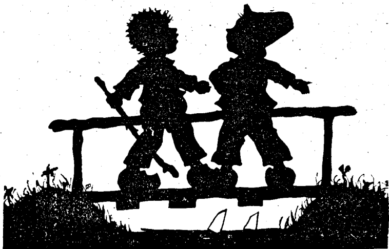
Două pietre tari, scapără scânteii!

Dintre toate omagiile cari se pot aduce unui poet, acela de a-l cumpăra este cel mai sincer și care-l impresionează cel mai mult. — V. Cherbuliez.