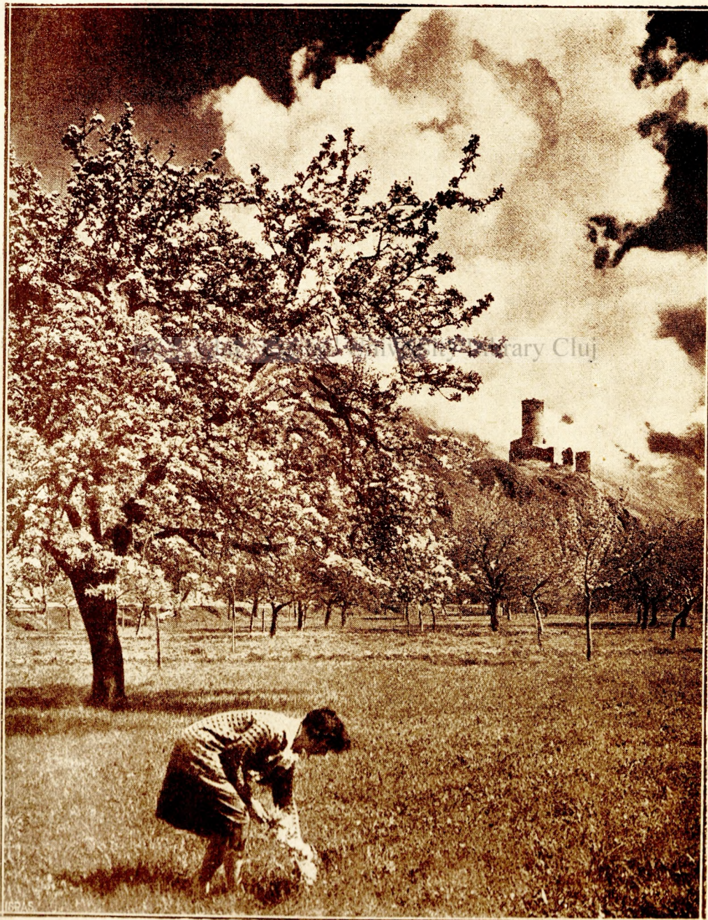
Fol. Darbellay, Martigny.