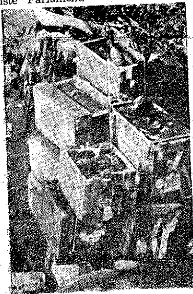
Capturi luate de luptătorii Armatei Democratice

Nu se știe însă cum au reacționat ceilalți șefi ai regimului monarho-fascist față de această rezolvare și nici dacă va continua să existe Parlament.