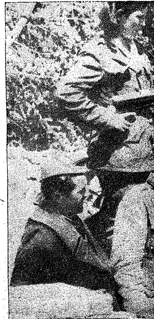
Printr'un tir bine dirijat, luptătorii