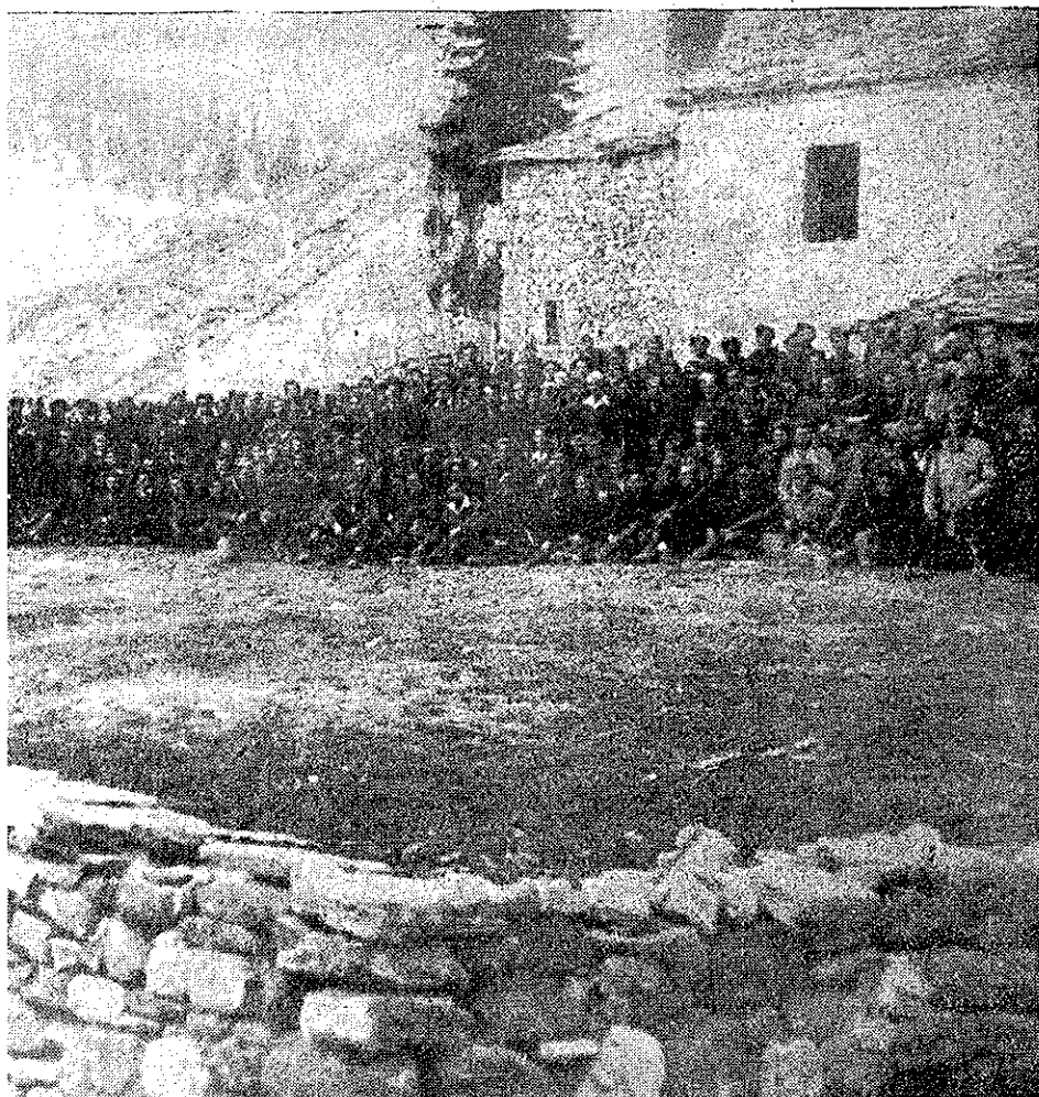
Armiile unei unități a Armatei Democratice