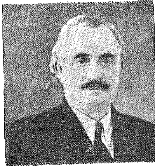
GHEORGHI MIHAILOVICI DIMITROV

Semnat: COMITETUL CENTRAL AL PARTIDULUI COMUNIST (BOLȘEVIC) U.R.S.S. CONSILIUL DE MINIȘTRI AL AL U.R.S.S.