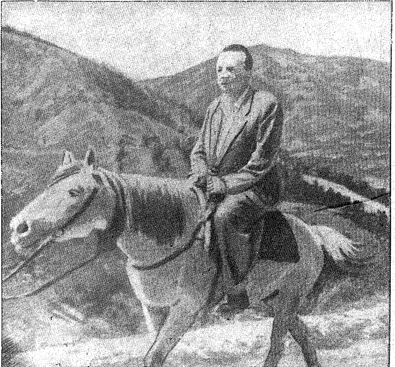
PAUL ELUARD URCAND IN MUNTII GRAMMOS

Pentru a ajunge, cu delegația franceză la Comanda mental General al Armatei Democratice, Paul Eluard a trebuit să meargă călare.