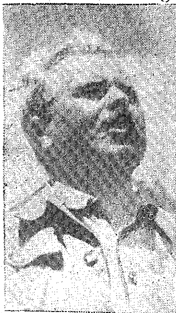
M. PARTSALIDIS Președintele Guvernului Democrat Provizoriu al Greciei Libere