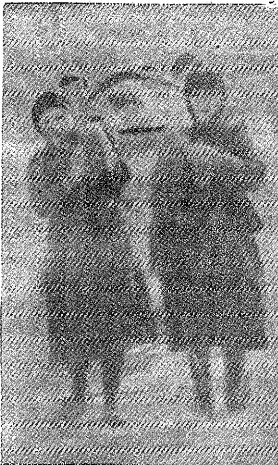
Tărâncile din Grecia, transportă pe luptătorii răniți în lupta contra monarho-fasciștilor