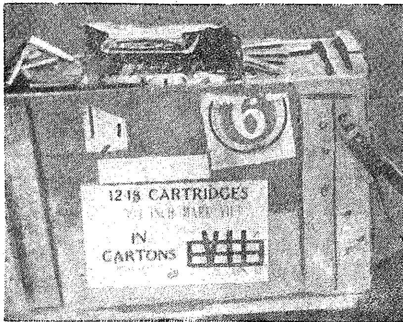
Arme ușoare engleze și muniții americane