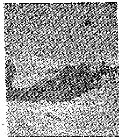
Luptătoare ale Armatei Democrate la instrucție