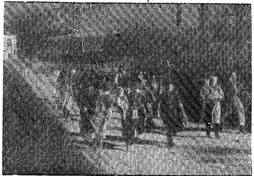
Exodul populației la apropierea monarho-fasciștilor

Firește, nu este vorba de a da aici o biografie a acestor domni și nici de a menționa rolul lor de spioni, trădători și colaboratori din timpul ocupației trecute.