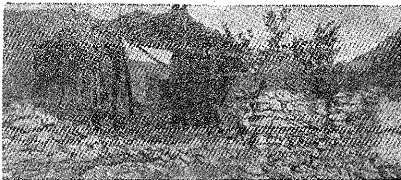
Din binefacerile „ajutorului” american în Grecia

Nu am calculat încă exact ce ce vor costa până la urmă pe contribuabilii greci aceste „prețioase persoane”, deși contribuabilii greci vor avea destul pentru banii lor dacă acești copoi vor reuși să descurece contabilitatea miniștrilor-gangsteri-contrabandiști. Însă aceasta ar însemna fără îndoială să căutăm paf în ou.