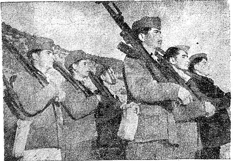
Vajnicii luptători ai Libertății

Deaceea, sub îndrumarea Guvernului Democrat Provizoriu, își vor înzeca puterile și stră-