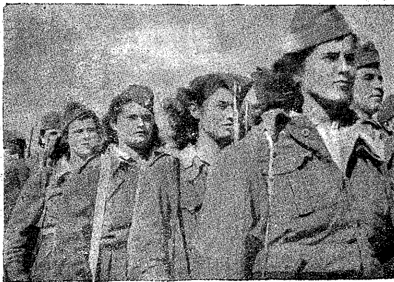
Cuțarm în mâni luptătoarele Armatei Democratice luptă pentru independența și libertatea patriei

Cu o deosebită emoție, delegația greacă, a primit pe scenă buchete de flori din partea muncitoarelor și muncitorilor din București, care erau însoțite de cuvinte pline de dragoste și ațâșament.