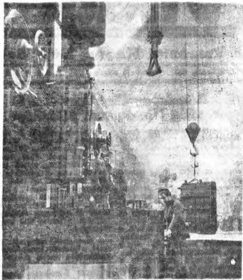
Régez 12 órát dolgoztak az emberek a sötét, füstös Putyilov-gyárban, ma a legkorszerűbb felszereléssel, a legegészségesebb körülmények között gyártják a gépeket a kommunizmus építkezéséhez.