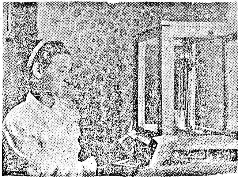
Az iskola laboratóriumában gyakorlati oktatás folyik.

elemét is. Tanulmányaikat tovább folytathatják felsőfokú intézetekben és mérnöki képzést nyerhetnek. A zilahi szakiskola végzett növendékei az állami terménybegyűjtő bizottság vezető és ellenőrző technikus káderei lesznek. Az ösztöndíjas tanulók ingyenes ellátást, lakást és tandíjmentességet élveznek. A terménybegyűjtési középfokú szakiskolába 14—25 éves életkorú, 7 elemi osztályt végzett növendékeket vesznek fel, az iskolához intézett és a szükséges iratokkal ellátott kérvény, valamint felvételi vizsga alapján.