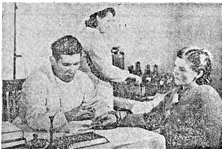
A kolhozok mellett létesített egészségügyi gondozó állomások széleskörű szűrő-vizsgálatot végeznek.

A ma páratlan eredményei csak kezdetei a szovjet egészségvédelem további hatalmas fejlődésének. Nem is lehet másképp a szocializmus hazájában, ahol az ember a legfőbb érték és ezt az elvet szolgálja a feltartóztatlan fejlődés.