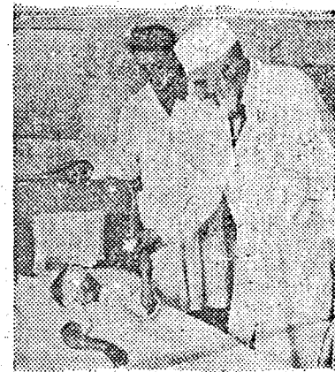
Filatov professzor sebési beavatkozás útján visszaadta egy kislány látását. A professzor a sikeres operáció után kis páciensének virágot nyújt át

... Az iskolaegészségügyi tanszék bemutatótermében a hallgatók nagyméretű modell állnak körül, amely egy iskolai