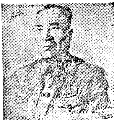
Csu Te, a Kínai Népköztársaság központi népi kormányja elnökhelyettese és a kínai néphadsereg főparancsnoka. (Finogonov szovjet művész rajza).

Csu Te, a kínai népi felszabadító hadsereg főparancsnoka szegény parasztesz család gyermeke. Családjuk főtámasza az édesanyja volt, aki nemrég halt meg 85 éves korában. Az ő emlékének szenteli Csu Te az alábbi sorokat.