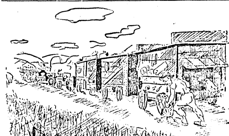
A csatányi néptanács határidő után vontatott be javításra három cséplőgépet és két traktort a dési gép- és traktorállomásra.