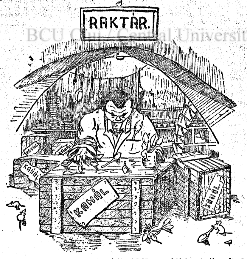
Az ortopéd kórház adminisztrációs felelőse a raktárban tartja a kanalakat, emiatt a betegeknek egymásra kell várniuk az ebédnél.

Az ilyen és ehhez hasonló hiányosságokat az ortopéd kórház alkalmazottainak munka iránti magatartása is fokozza. Az ápolónők és az alkalmazottak nem minden alkalommal teljesítik feladataikat. Több esetben megtörténik, hogy elhanyagolják a tisztaságot és kése, vagy egyáltalán nem teljesítik a betegek jogos kéréseit. Így például az adminisztrációs felelős (raktárnok), hosszú időn keresztül nem adott kanalat a betegeknek, holott bőségesen volt evőkanál a raktárban. Megtörtént az is, hogy a betegek későn kapták az élelmezést, vizet, stb. A hiba onnan származik, hogy az igazgatóság és a néptanács egészségügyi osztálya nem ellenőrzi megfelelő mértékben az alkalmazottak munkáját. Nem fordítanak gondot arra, hogy a helyi erőforrások