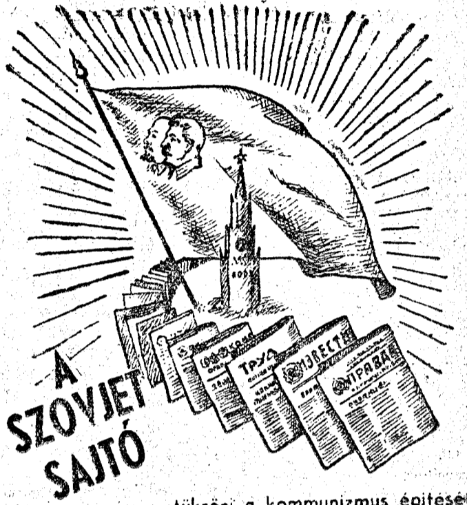
tükrözi a kommunizmus építését a Szovjetunióban.

VÁROSAINAK MOZI MŰSORA: eskü. Május 31—június 3: A barna kőd. SZAMOSUJVÁR: Figaro házassága. Május 29—31: Az elefánt és a kőtelecske. TORDA: Titkos kincs. Május 29—31: Kotovszky-bírság. ZILAH: Párizs gyermeke. Május 29—31: Mánás Miska. ZSIBÓ: Május 28—30: Az elefánt és a kőtelecske. Június 5—7: A boxbajnok.