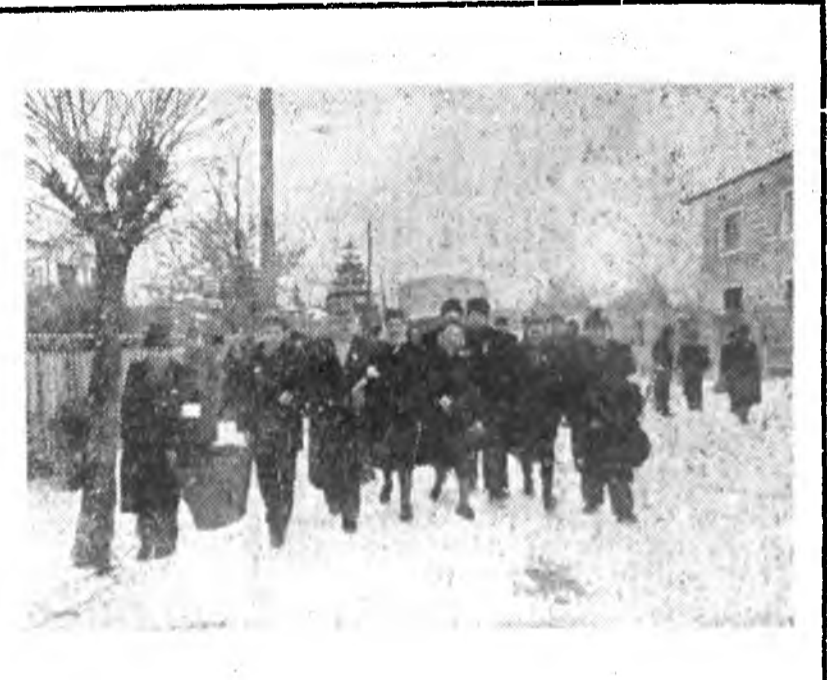
Kolozsvár minden kerületében január 21-én már korán reggel gyülekezni kezdtek a koreai gyűjtőcsoportok. A MNSz V. kerületi szervezetének Türr István-utcai székházából elsőnek indul el a CFR Kolozs-tartományi kirendeltségének egyik gyűjtőcsoportja.

A mezőgazdasági szerszámok kijavításában Torda-rajon halad az élén. A rajon dolgozó földművesei a 98 jól ellátott javító központ segítségével elérték azt, hogy a tartomány területén az első helyre kerültek a szerszámok előkészítésében. A többi rajonok dolgozó földműveseinek igyokozniuk kell, hogy az előirányzott mezőgazdasági szerszámokat minél több kijavítsák.