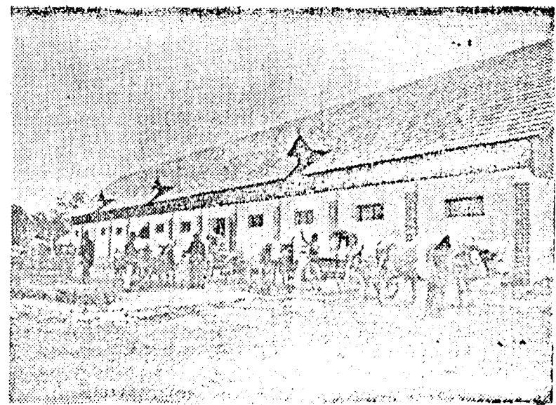
A gerendi kollektív gazdaság dolgozói lebontották a régi, dülledő istállót és helyette új, korszerű épületet emeltek. Az épületben több, mint 80 darab állatnak jut kényelmes férőhely.