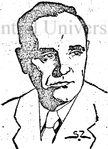
Nemzetgyűlés Elnöki Tanácsa most élő valósággá tette új alkotmányunk rendelkezéseit és államosította a dolgozó nép közös javává, kizárólagos tulajdonává tette a legfontosabb ipari, pénzügyi, biztosítási, bányászati és szállítási vállalatokat. Uj fejezet nyílt Népköztársaságunk történetében. A gazdaságilag felszabadult nép tovább építheti hazáját a boldogabb jövőért a szocializmus felé.

Uj fejezet nyílt Népköztársaságunk történetében. A gazdaságilag felszabadult nép tovább építheti hazáját a boldogabb jövőért a szocializmus felé.