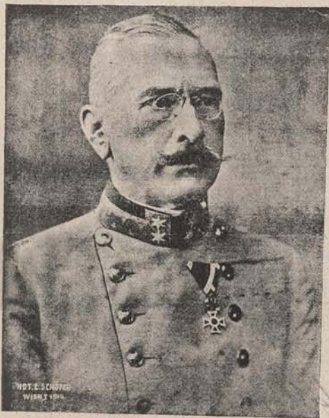
Generalul Dankl, comandantul aripei stânga a armatei austro-ungare luptătoare în Galiția, eroul dela Krasnik și Duza. Retras acum, cu generalul Auffenberg, la matca (centrul) armatei, sub Lemberg.