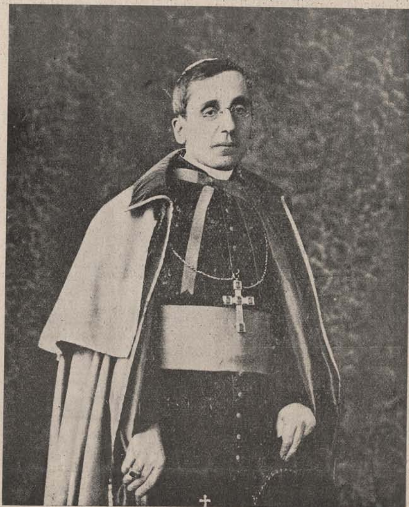
Noul Papă, care își ocupă tronul sub numele de Benedict XV.

Poate mai des se află obiecte cioplite din nefrit. Despre originea acestor obiecte, părerile sunt dife-