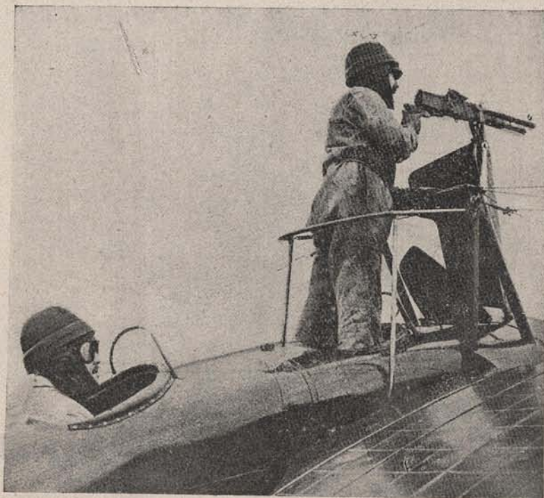
Mașină de zburat, în armată cu mitralieză (mașină de pușcat).

Printre cei cari au luat parte la discuția asupra acestei teme, e și miliardarul Carnegie, marele filan-trop, și ajunsese a numi și el abia nainte cu o săptămână, în ziarul „Public Ledger“ din Filadelfia, pe Împăratul Wilhelm, drep „tulbu-rătorul principal al păcii Europene și singurul pro-vocător al acestui războiu!..“