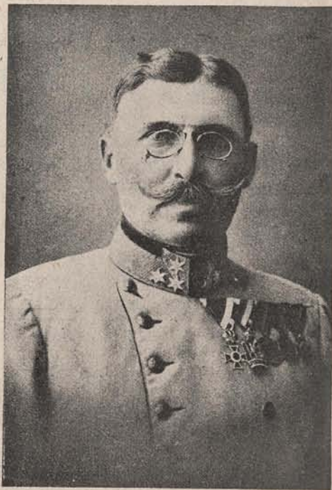
Generalul Auffenberg, inspector al armatei, eroul dela Tamos-Tysovetz, care alătura de Dankl a dus lupte brave pe pământ rusc. Acum s'a retras cu Dankl cu tot la matca (centrul) armatei, din jos de Lemberg.

Oare dintre cele trei tipuri de ziariști , cari sunt mai de folos pres-