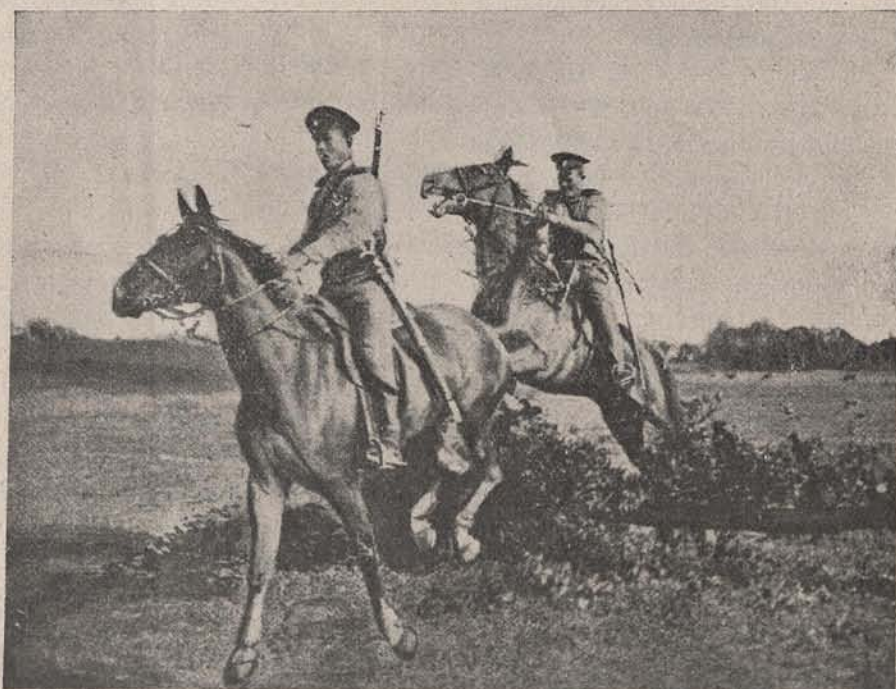
O patrulă de călăreți ruși în avantposturi.

Apoi, ce însemnătate colosală li se va da învingerilor cât de mici, venite din parte dușmană, dacă dușmanii nostri sunt atât de amărâți și prăpădiți. Vedeți, publicul nostru crede că Franțuzu cât ce vede un neamț, se zvârle pe burtă, și că Rușii așa au tulit-o de frica noastră, și până la Irkutsk cu siguranță nu se mai opresc!, — de sârbi nici să nu mai pomenim, — ș'apoi dacă din întâmplare omul dă cu ochii prin vr'un colț de jurnal de o știre strecurată care spune că vreo patrulă de a noastră s'a ciocnit cu inamicul, dar acela încă a tras câteva focuri de carabină, ori că: din tactică ne-am retras, etc., din încrederea cea mai mare îi vezi pe oameni numai cum se în-