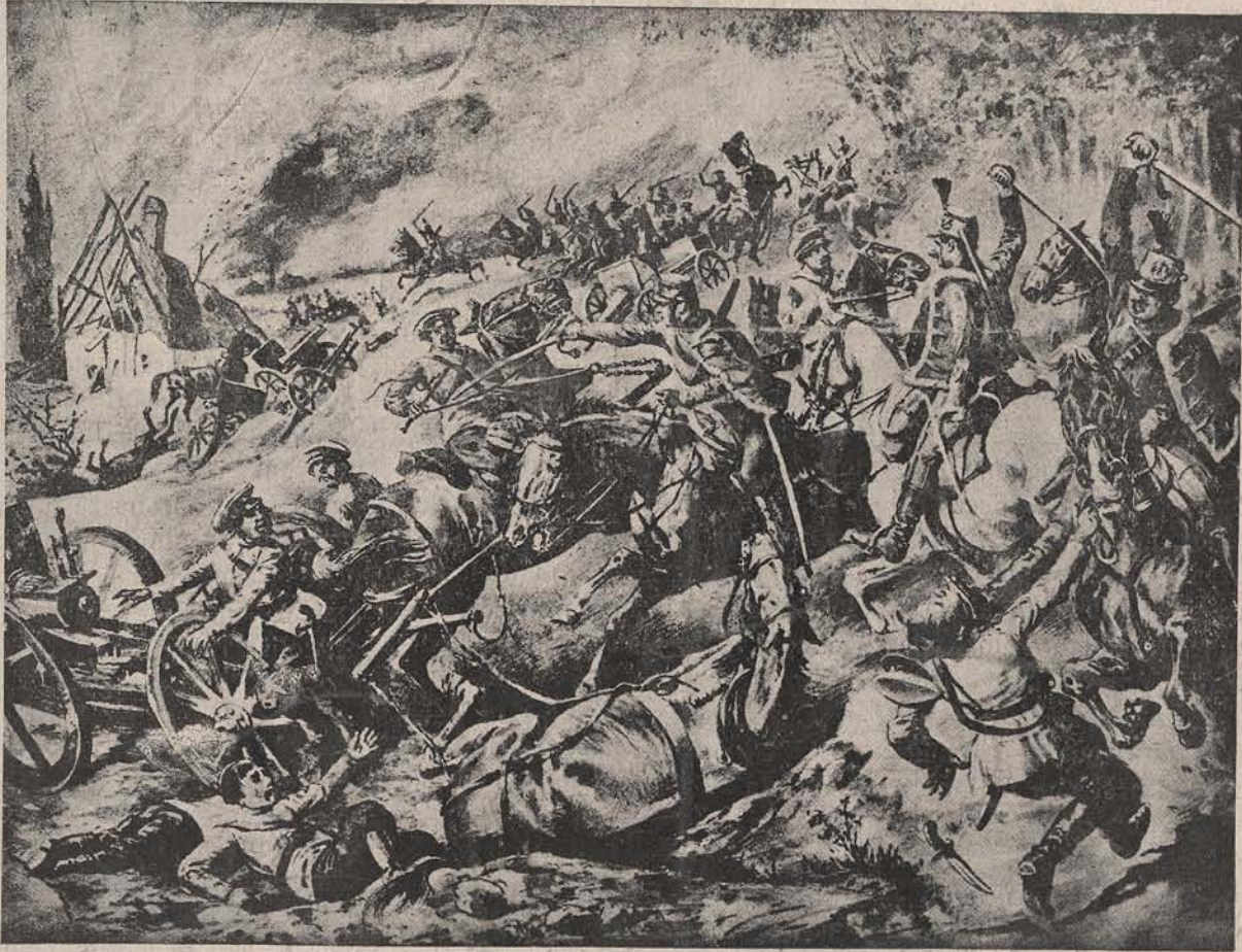
Cumplit' atac de cavalerie la Sattanov, în Rusia. E divizia de husari-honvezi, care, trimisă în o periculoasă recunoaștere, a suferit acolo grele pierderi, dar a și făcut stricăciuni în dușmanii cari o împresurau.