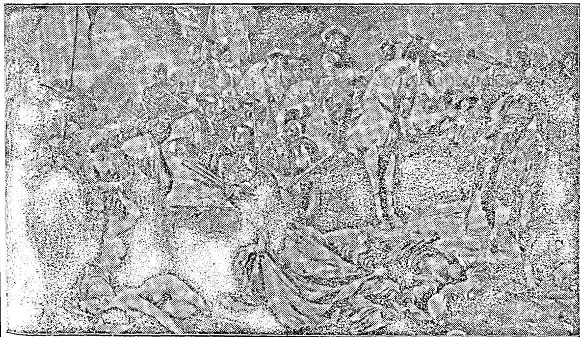
A keresztény sereg Budavárában.

tében van a Balkán-háború, amelynek során 1912-ben Bulgária, Szerbia, Görögország, Montenegró fölszabadító harcukat megvívták a törökök ellen. Budavára már 1686-ban fölszabadult a török igából, további harcok során