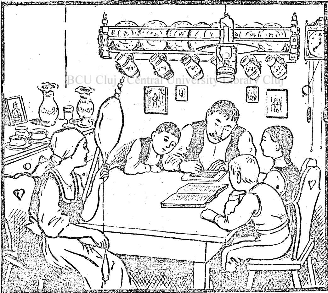
Téli kép erdélyi magyar faluban.

azzal töltik a téli estéket, hogy versenyezve pergetik az orsót a fehérernyős lámpa fénye mellett. Remélik, hogy tavaszon már bőven lesz fonaluk, amit fölvessenek és megszöjének. Ugy számítják, hogy egész családjukat el tudják majd látni szőlteményekkel.