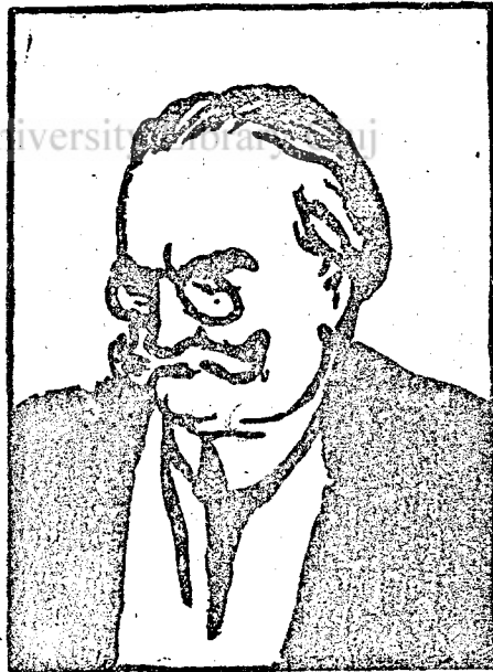
Vajda, az új miniszterelnök.

közölt arcképen is látható, — csak lengett és lobogott, mint fekete zászló és ez a fekete zászló azt jelképezte, hogy a tizenhárom hónapos uralom alatt gyásztaláltak a tisztviselők, mert nem kapták meg a fizetésüket, a nyugdíjasok, mert nem vehették fel a nyugdíjukat, gyásztal egész Erdély, mert Bukarestben úgy kezelték, mint gyarmatot és gyásztal különösen a földmives, iparos, kereskedő, mert csak az adószedők, a végrehajtók és különböző inspektorok működtek és vitték a pénzt Buka-