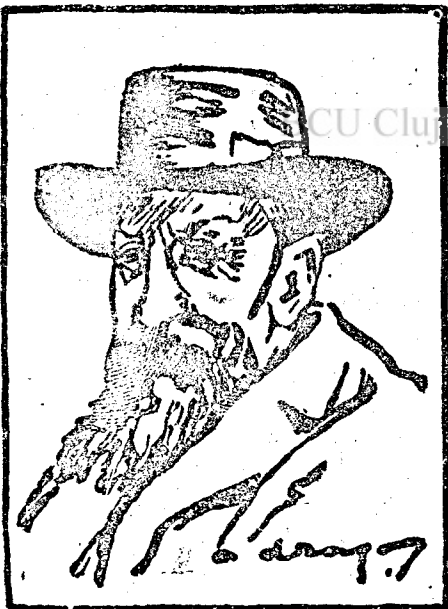
Jorga, a lemondott miniszterelnök.

Tizenhárom hónapot uralkodott a Iorga-kormány. A tizenháromas szám mindig szerencsétlenséget jelentett. All ez a szakértői kormányra is, mely tizenhárom hónap alatt az ország gazdasági életét a tönk szélére juttatta és a szakértelemnek a teljes hiányával megakasztotta az ország gazdasági életének a rendszeres vérkeringését.