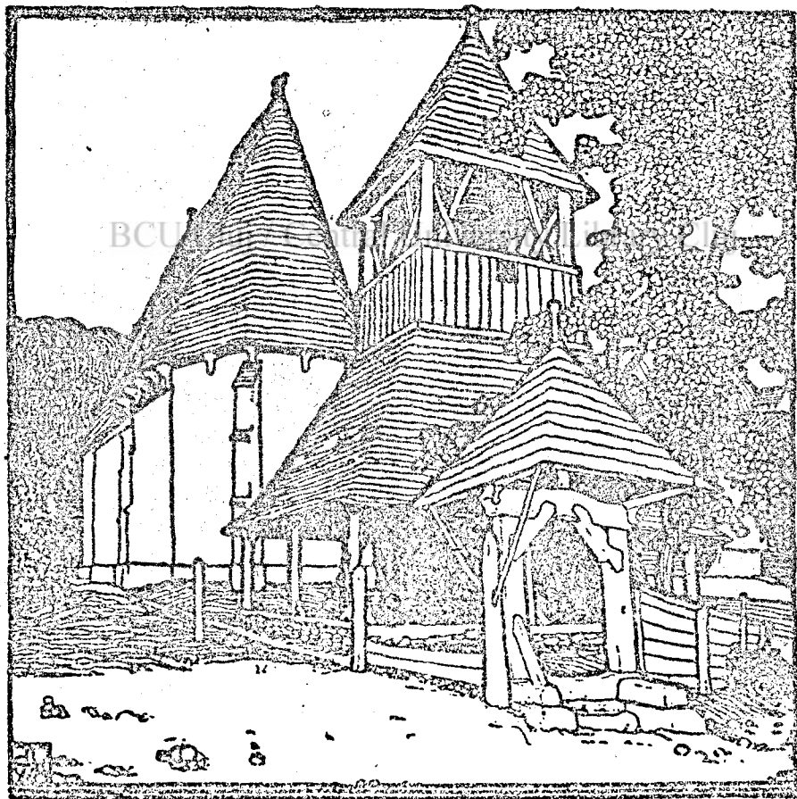
A viczei templom.

A Melles-patak mentén fekszik Vicze község is. Elzárva világtól, távol kulturától, emberektől; csendes egymásutánba következő