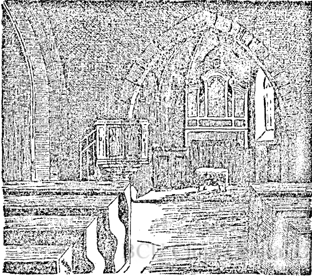
A gerneszezi református templom belseje.

bűségével és vitézségével érdemesítette magát szép új birtokára. Részt vett a török ellen Nikápolynál vívott nagy, de szerencsétlen ütközetben (1395) s a Dunán készen tartott hajón segítette elmenekülni Zsigmond királyt. Azután Knin várát védte meg a horvát és bosnyák fölkelők ellen, majd elkísérte urát német császári koronázására s a híres konstanci (Svájc) zsinatra (1418). Külföldi útjában (1415) nyeri címerét is, a kék paizsban kiterjesztett szárnyu, aranykoronás, ezüst gólyamadarat, a nyakára tekerőző kígyóval.