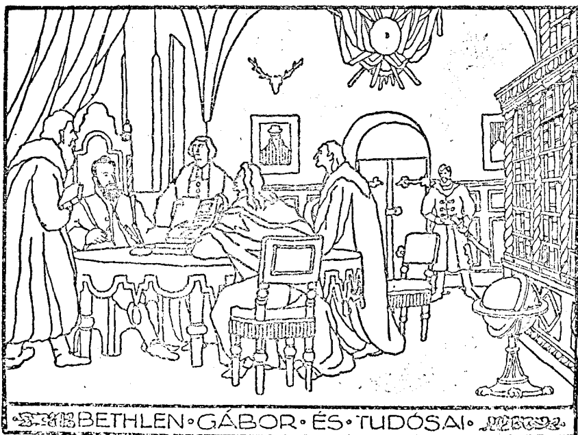
BETHLEN GÁBOR ÉS TUDÓSAI

Gyulafehérvár helyén azért mégis volt valami erősségféle; amikor a magyarok ezelőtt ezer esztendővel megjelentek ezen a vidéken. A várat elfoglalták és Gyula nevű vezérükről nevezték el. Ezzel megindul a város újabb fejlődése. Mikor a magyarok áttértek a keresztyén vallásra, az erdélyi püspököknek itt lett a székhelye. Szép templomot építenek; alapfalai megvannak a mai püspöki székesegyház alatt. A tatárok pusztították el épen most 680 esztendeje. A pusztító ellenség azonban csakhamar elvonult és IV. Béla király országépítő munkájából kijutott Gyulafehérvárnak is. A réginél nagyobb, szebb templom épült. Hétszáz esz-