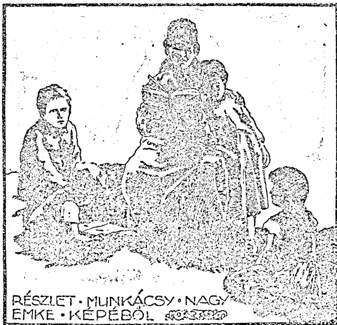
RÉSZLET MUNKÁCSY NAGY EMKE KÉPÉBŐL

Képeinken bemutatjuk a legnagyobb alzsánnát; Munkácsy részletét és Sándor titkárt, akit már Emke megalapítás tékes diszkehelye teltek meg az egy a gyűrűt eladva, árát az Eri tette le alapítványul, a kelyhet pedig a hozzátatózó tányérral együtt a kisbarcsai, hunyadmegyei magyaroknak adta urvacsorakészletül.