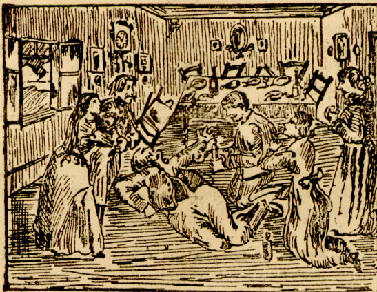
Și-a deschis ochii și șoptind zicea: „mai dăm, mai dăm!”

pre pilule-Elza și îndată le-a și comandat de la apotecarul Feller V. Jenő din Stubica, Centrale nr. 35. (Zágráb-megye) o duzină, adică 12 sticle din Fluidul-Elza în preț de 5 coroane și 6 lăcrufe de pilule-Elza pentru 4 coroane. Cheltuelile postale le-a purtat apotecarul. La ziua de 3 ori câte 20 de picături amestecate într'un pahar cu lapte și se freca pe la rânză de câte 2 ori la zi cu adevăratul Fluid Elza și pe tot locul, unde simțea dureri, din pilule-Elza inghițea în fiecare zi câte 4 și starea lui se îndrepta pe zi ce merge, acum e sănătos de deplin și fiecareia recomandă acest leac adică