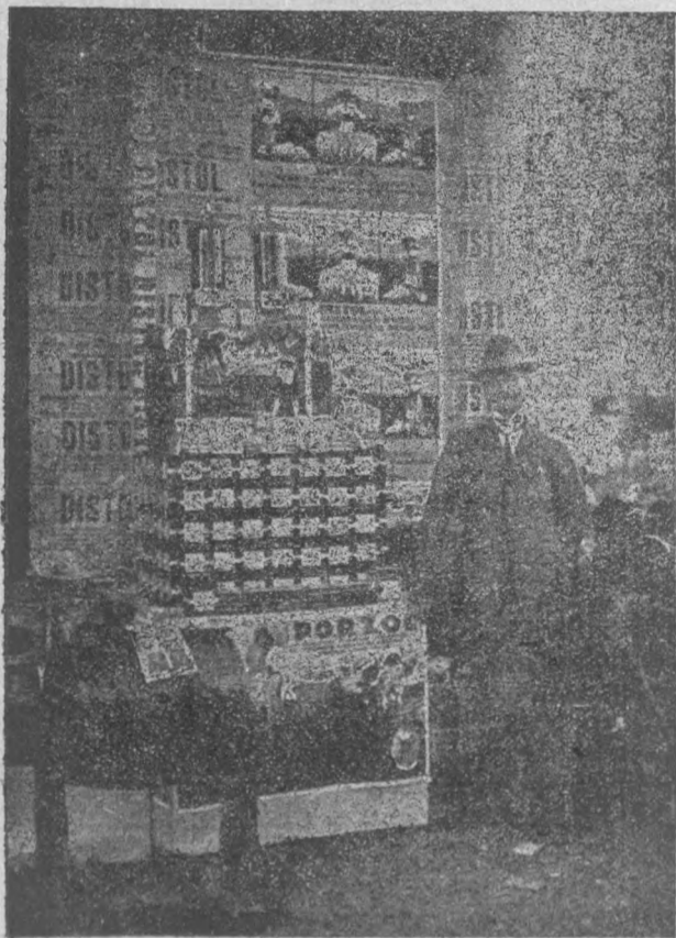
A Distol és Porsol bemutatója.