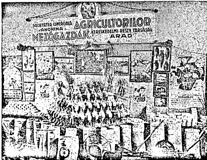
A „Mezőgazdák” kiállítása.